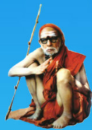
గురు చంద్రశేఖర పరమాచార్య