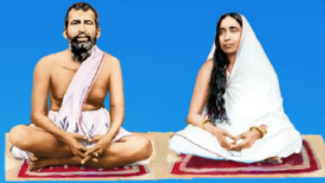
గురు రామకృష్ణ పరమహంస అమ్మ కాలదా దేవి